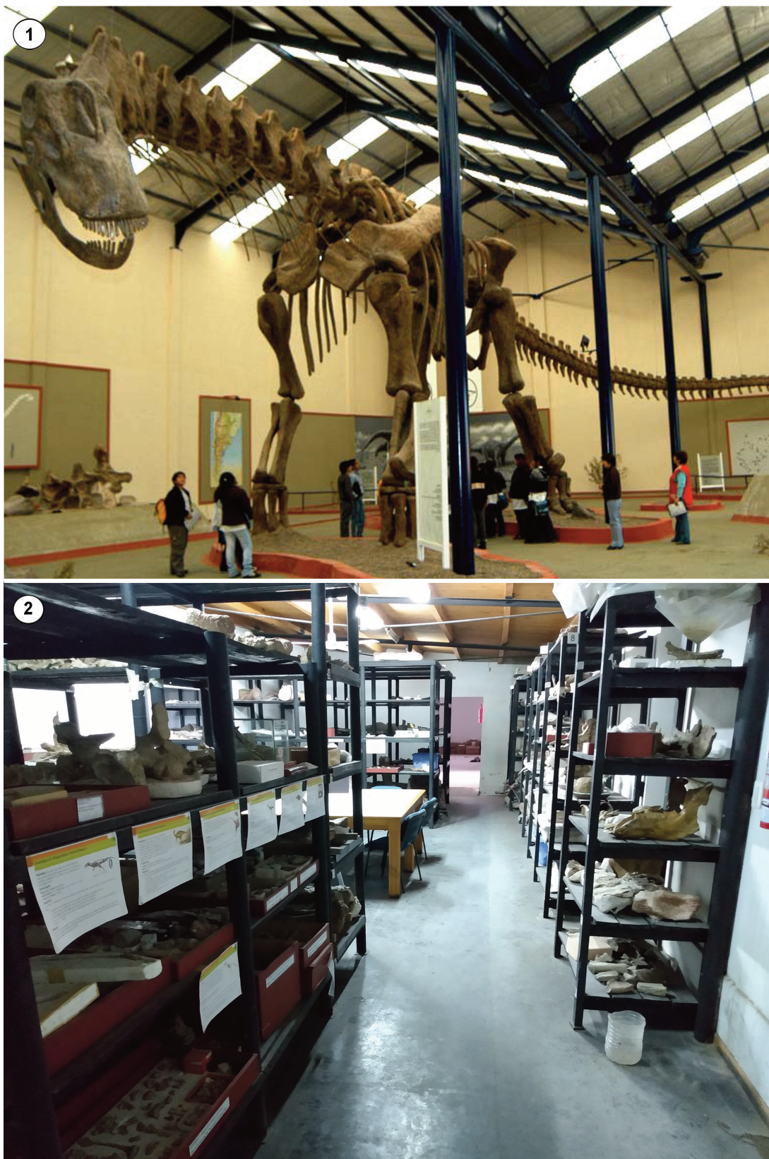
Figura 2. 1, Sala de Paleontología en donde se expone la reconstrucción del esqueleto completo en escala 1:1 de Argentinosaurus huinculensis Bonaparte y Coria, 1993. 2, Aspecto actual del sector ocupado por la colección paleontológica del Museo Carmen Funes.