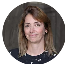
Sol Noetinger Diseño, comunicación y redes sociales