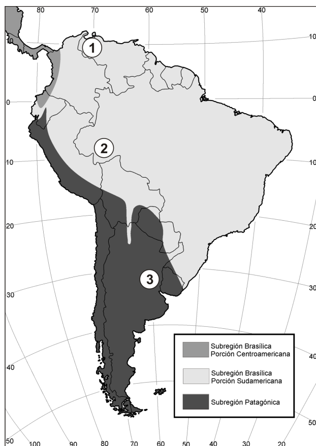
Figura 1. Mapa de América del Sur indicando la ubicación de las localidades mencionadas en el texto y subdivisiones de la Región Neotropical según Hershkovitz (1958). 1, Urumaco, Venezuela; 2, Acre, Brasil; 3, “Mesopotamiense”, Argentina.